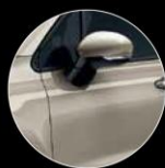
231 BEIGE CAPPUCINO