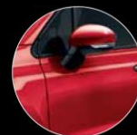
942 ROSSO AMORE