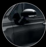
601 NERO CINEMA