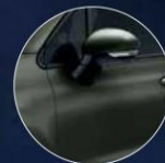
149 VERDE OPACO