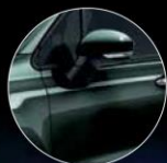
019 TECHNO GREEN