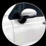
296 BIANCO GELATO