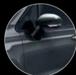
679 GREY DARK