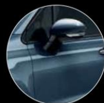
731 BLUE JEANS