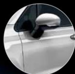
348 GRIGIO ARGENTO