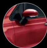
895 ROSSO PASSIONE