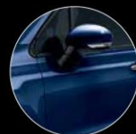
888 BLU VENEZIA