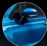
018 BLU ITALIA